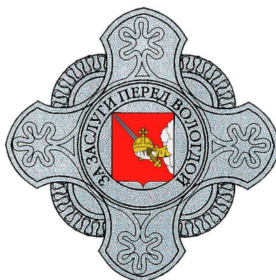
Рисунок нагрудного знака «За заслуги перед Вологдой»

УТВЕРЖДЕН постановлением Главы города Вологды от 14 февраля 2017 года № 45