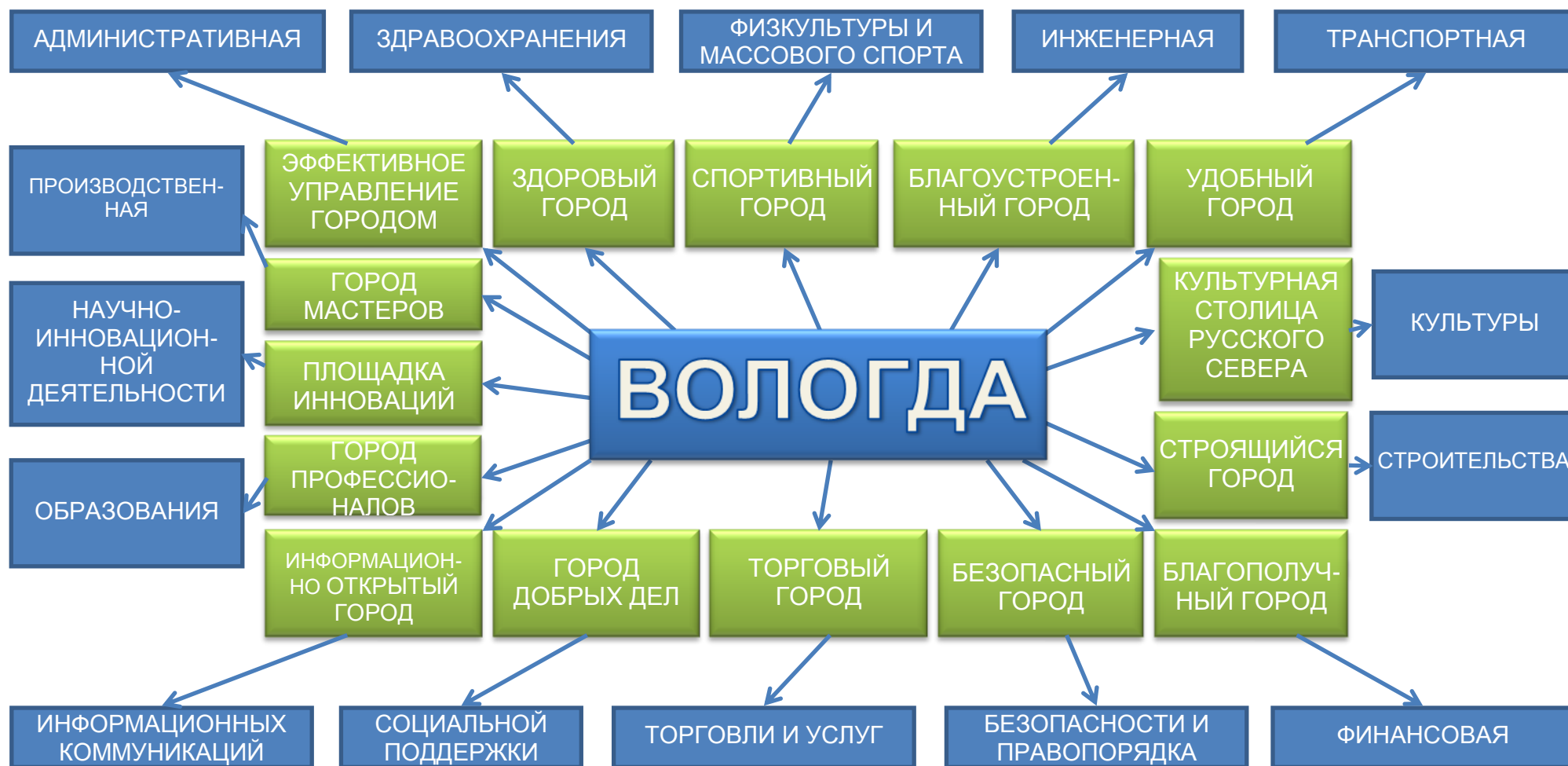
Рис.1. Сопоставление стратегик развития города с инфраструктурами