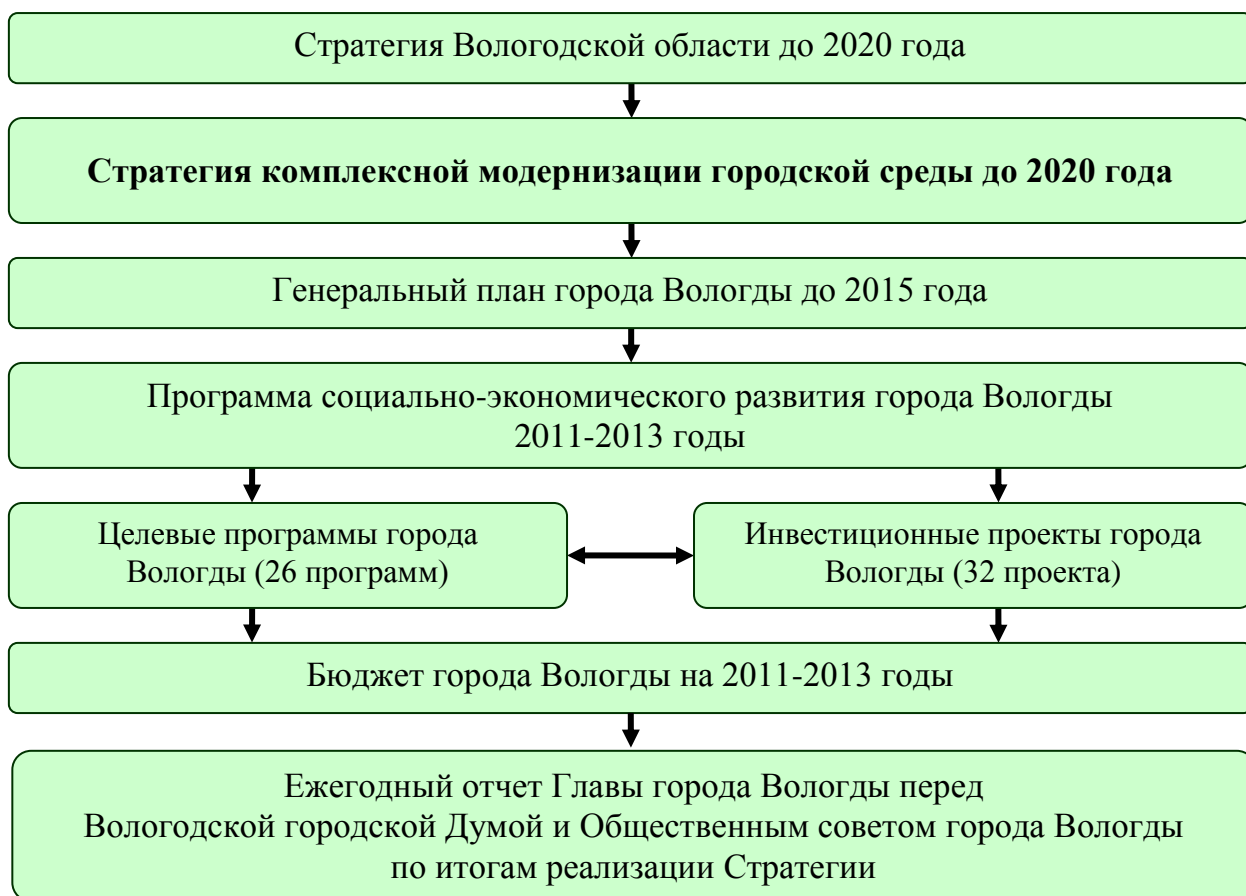
Рис. 5. Существующая схема системы стратегического управления города Вологды.

<В Вологодской области принят закон о формах участия Вологодской области в государственно-частном партнерстве, главная цель которого – стимулирование реализации социально значимых проектов, привлечение инвестиций, эффективное использование ресурсов и повышение качества товаров и услуг>